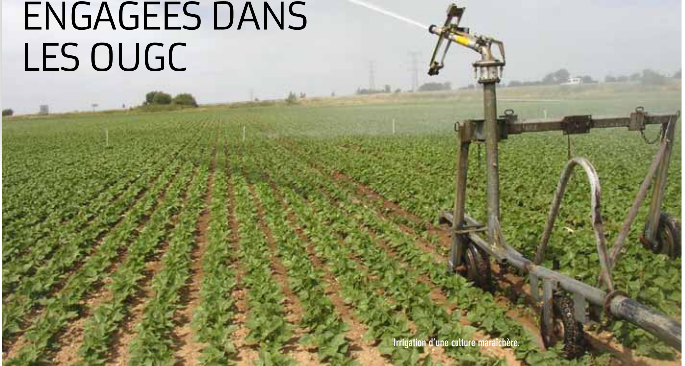
Irrigation d'une culture maraîchère.