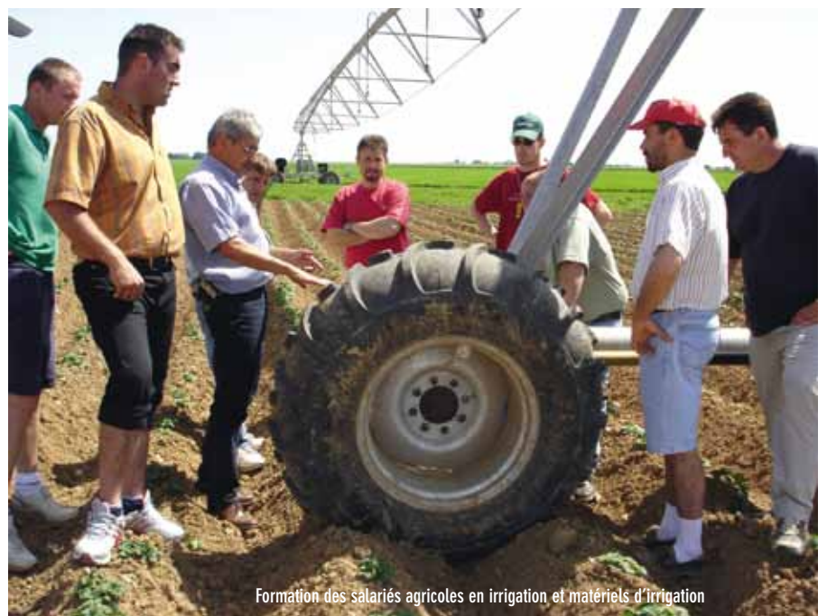
Formation des salariés agricoles en irrigation et matériels d'irrigation

Le règlement intérieur, fixant les règles de fonctionnement entre l'OUGC et les irrigants compris sur son périmètre, a fait l'objet d'un « Guide d'aide à la rédaction des règlements intérieurs des OUGC ». Ce travail a été réalisé grâce aux contributions des référents régionaux « irrigation » du réseau des Chambres d'agriculture, en partenariat avec la FNSEA, Irrigants de France et Jeunes Agriculteurs.