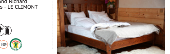
Logement disponible dans une ferme.